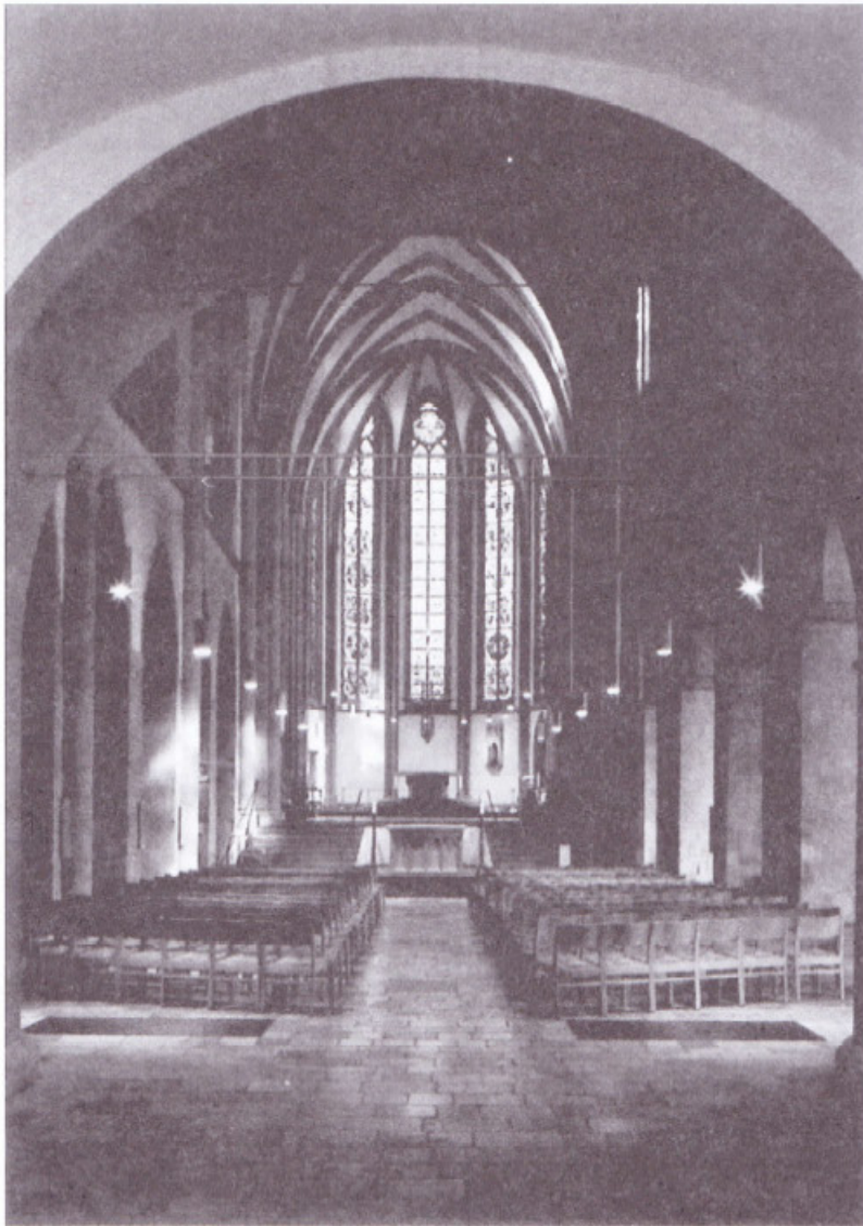
St.-Vitus-Münster in Mönchengladbach